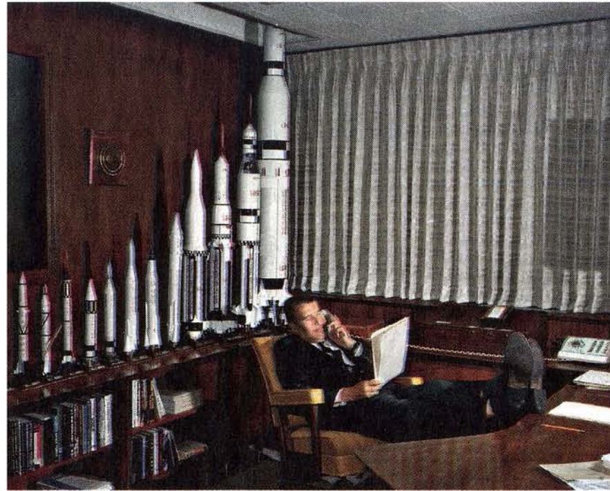
Foto uit Moonfire : dr. Wernher von Braun, ontwerper van de Apollo-raket, in 1964

Mailers omslagverhaal van de missie van de Apollo 11 werd het grootste, uit drie delen bestaande non-fictieverslag dat ooit in het magazine was gepubliceerd. Mailer noemde het Of a Fire on the Moon . Mailer was een van de exponenten van de stroming New Journalism. De verslaggever smeedde de feiten om tot een belevings en plaatste zichzelf als deelnemer in de gebeurtenis. Mailer sprak met de secretaresses achter de typemachines, probeerde de