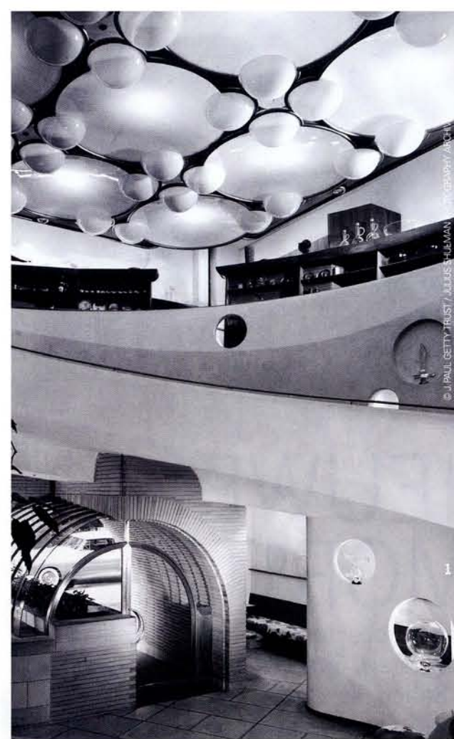
1 Interieur van de Gift Shop voor V.C. Morris in San Francisco (1948). 2 Tekening voor het gebouw van S.C. Johnson & Son in Racine, Wisconsin (1943). 3 Harmonie tussen natuur en gebouwde omgeving bleef een van de stokpaardjes van Frank Lloyd Wright. Buitenkant van het Randall Fawcett House, Los Banos, California (1955).