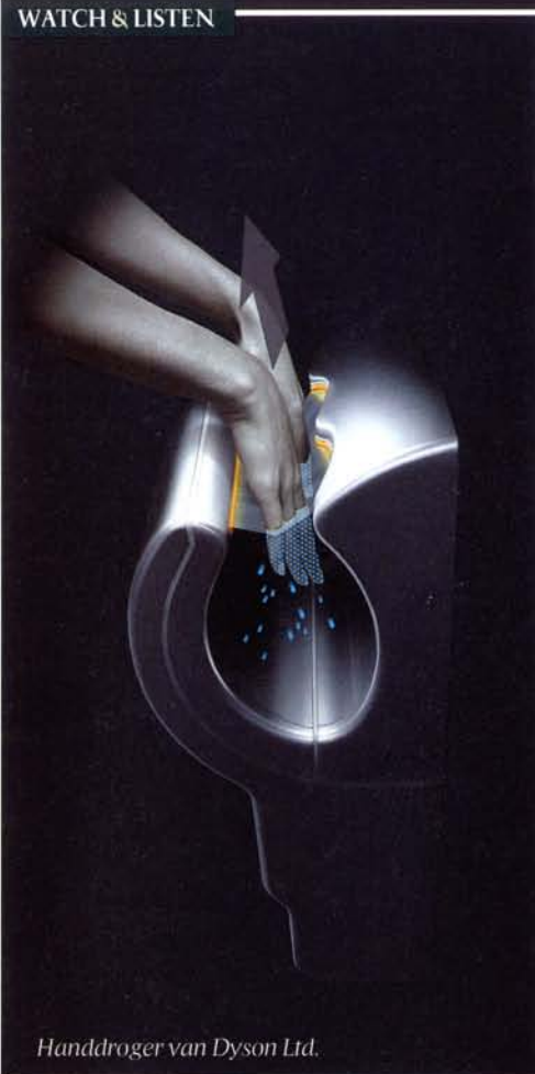
Handdroger van Dyson Ltd.