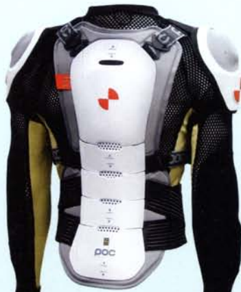
Torso Armor ski protectiejack van POC Sweden