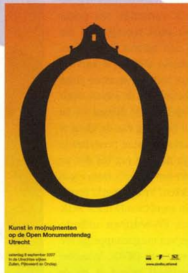
En Publique. Affiche Open Monumentendag (2007)