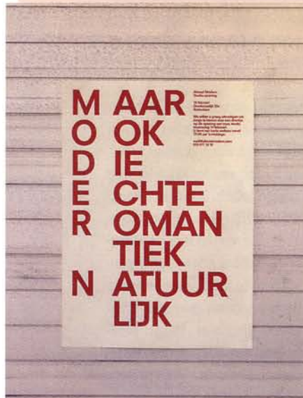
Almost Modern. Eigen affiche (2007)

'Grafisch design in Nederland. Een overzicht van de hedendaagse grafische vormgeving'. Genaaid gebonden, 312 pagina's op formaat 19x25 cm (staand), gestoken in een strakke foedraal van doorzichtig plastic. Alleen dat laatste al is weer typisch 'Dutch Design'. Uitgave: Librero, www.librero.nl ISBN 978 90 5764 860 1 Prijs € 19,95